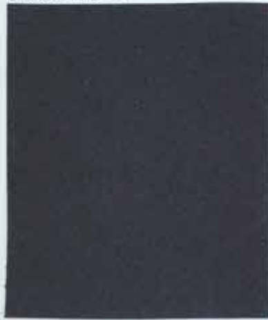
5. Peter Behrens