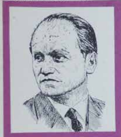
3. Hermann Zapf, geb. 1918