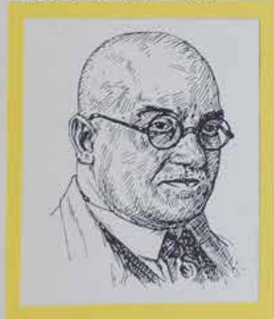
4. Rudolf Koch (1876-1934)