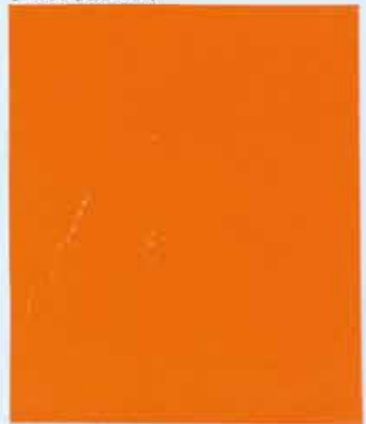
6. Otto Eckmann