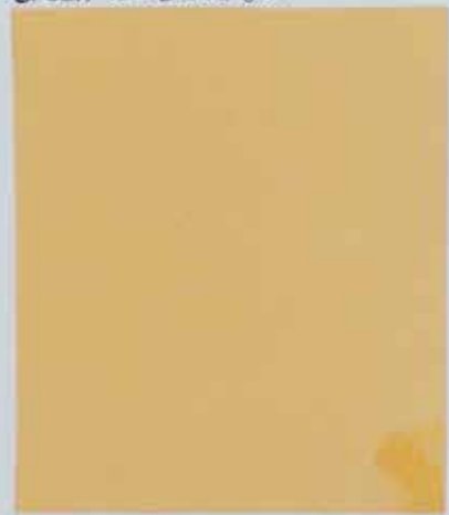
7. Alfred Riedel, geb. 1907